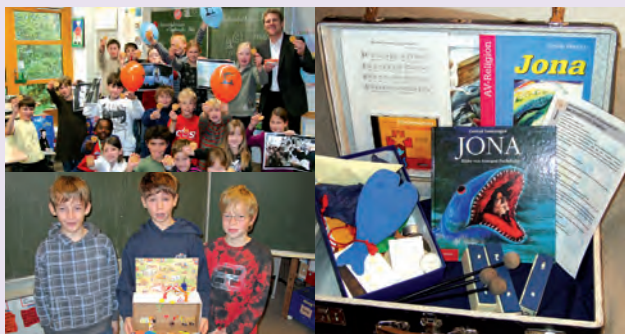
Luther im Unterricht, Bau von „Jenseitskisten“ und Jonakoffer.