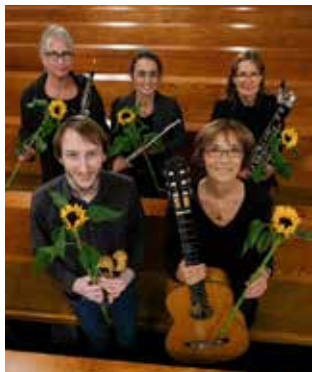
Die Musiker*innen von Querbeet

Es werden Stücke aus verschiedenen Epochen und Kontinenten gespielt, von Renaissance bis Klassik, irischen Traditionals bis Südamerika sowie eigens komponierte Werke. Die Mischung verspricht ein buntes Musikerlebnis.