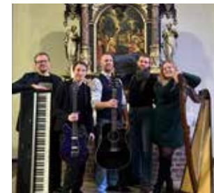
Die Eichedeer Band zeigt sich vielseitig

Die Band „Rock around the Church“ aus der Eichedeer Kirchengemeinde feiert ihr 20-jähriges Bestehen mit einem abwechslungsreichen Konzert. Das Publikum darf sich auf eine bunte Mischung aus neuen und bekannten Liedern freuen, ergänzt durch eindrucksvolle Solos, kreative Ar-