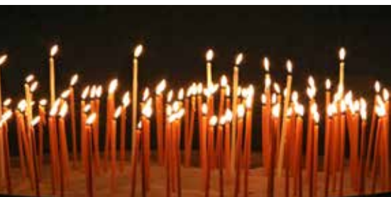
Wer den „stillen Freitag“ und den Ostertag nicht hat, der hat keinen guten Tag im Jahr.– Martin Luther

Die Überwindung des Todes und der Dunkelheit sowie den Sieg des Lichtes und des Lebens feiern wir in der Auferstehung Jesu. In dieser Jahreszeit bekommt dies eine besondere Spürbarkeit. Ostern ist der Weg aus der Dunkelheit ins Licht. Diesen Weg wollen wir mit Gottesdiensten in unserer Kirche begehen.