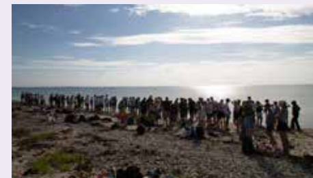
Auch 2025 geht es wieder auf die Insel. Es wird wieder bunt, laut und Gott ist mittendrin.